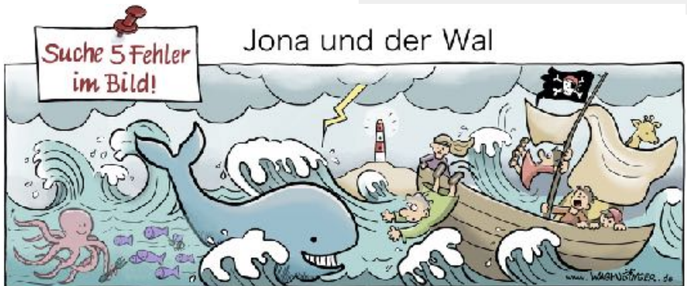
Gabel, Biene, Leuchtturm, Piratenflagge, Giraffe